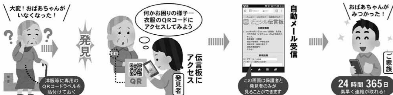
▼見守りシール利用の流れ