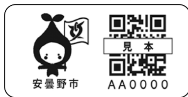
見守りシール実物大