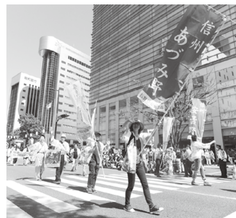
令和元年開催の様子

水環境審議会委員 水環境基本計画に関することなどについて審査、審議および調査を行う水環境審議会委員を募集します。 ④募集人員 若干名 ⑤任期 委嘱の日から2年間 ⑥報酬 会議1回3500円 ⑦対年間5回程度平日に開催する会議に出席できる市内在住・在勤の18歳以上の（①〜④を除く） ⑧①国・地方公共団体の議会議員②常勤の国家公務員・地方公務員③市の附属機関の公募による委員④市税の