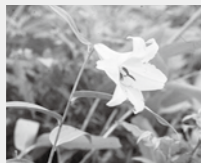
ササユリ (絶滅危惧I類)