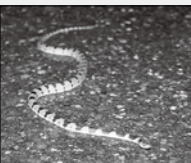
シロマダラ (情報不足)