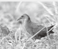
ヒクイナ (絶滅危惧I類)

市の「希少な生きもの」などを整理した安曇野市版レッドデータブックを平成26年に作成しました。作成してから10年近くが過ぎ、市の自然環境や生息・生育する動植物にも変化がみられています。最新の状況を反映するため、現在、レッドリストの改訂を進めています。改訂にあたり、市内の希少種の情報も集めています。希少な動植物に関する情報をながの電子申請サービス(左記2次元コード)からお寄せください。ササユリやヒクイナなどの絶滅危惧種や、シロマダラなど観察例がまれな種について幅広く情報を集めています。詳しくは市HPをご覧ください。