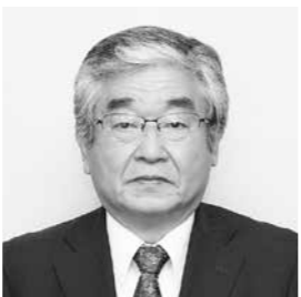
教育委員（教育長職務代理者） 遠藤 正志