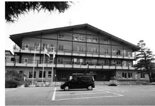
商工観光部を穂高総合支所内に設置します。

産業観光部を「商工観光部」と「農林部」に分離します。 ●商工観光部 工業製造品出荷額県内1位を誇る市の工業と商業の更なる発展を目指します。観光に