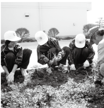
豊科北中学校での作業のようす(4月)

市では、市内の小中学校が必要とするさまざまな支援活動を、地域のボランティアの皆さんに関わっていただく、学校支援ボランティアを募集しています。この事業は、学校支援地域本部事業の一環で、地域の学校応援団といえる事業です。