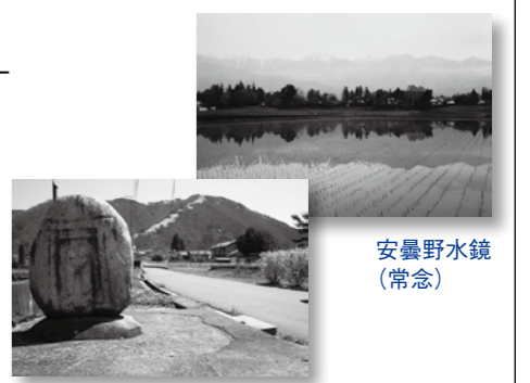
道祖神と城山桜 ～あづみの春～