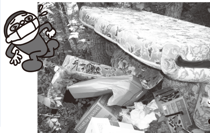
不法投棄された家庭ごみと寝具

市内の山林や河川などへ廃棄物を投棄する行為が後を絶ちません。また、「川から生ごみが流れてくる」、「指定集積所に粗大ごみなどが出されている」といった苦情も市役所へ多く寄せられています。これらはすべて廃棄物の不法投棄であり、決して許されません。不法投棄は景観を損なうだけでなく、悪臭や土壌汚染など環境へも悪影響を及ぼします。行為者は、不法投棄物の撤去を求められるほか、5年以下の懲役、もしくは1000万円以下の罰金、または両方が科せられる場合があります。ごみの不法投棄は犯罪です。