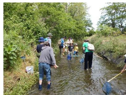
せせらぎ脇の水路では、水の中や草かげにいる生きものを捕獲!