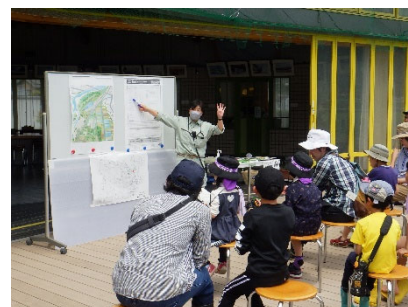
今回の観察会で見つけた対象種は全部で12種類(66種中)でした!