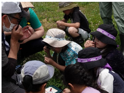
ルーペを使って植物の細かい形の違いや見分け方を学びました