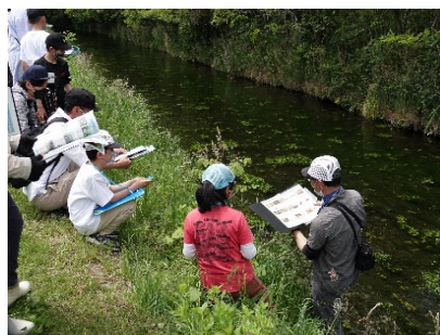
2班に分かれ、前半・後半でそれぞれ違った生きものを探します