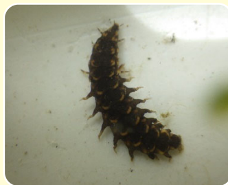
ヘイケボタル (幼虫)