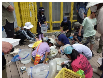
捕まえた生きものを種類別に仕分けて形の違いなどを観察