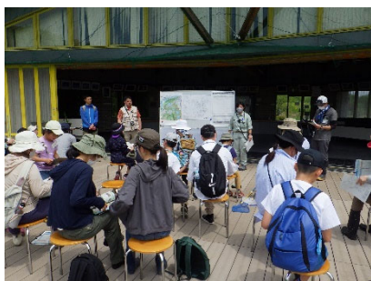
注意事項や生きもの調査の方法を聞いてから観察会に出発!