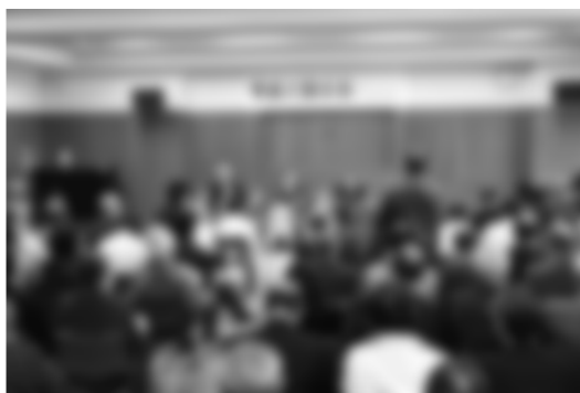
地域の課題を語り合う（11/23 掘金会場）

が話し合われました。市では、5会場でいただいた意見の概要と返答について、地域支援課窓口、市ホームページで公開する予定です。また、来年1月から2月にかけて「移動市長室」を開設し、理事者と直接対話する場をさらに設けます。詳しくは20ページをご覧ください。