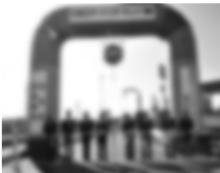
開通を祝いテープカット（上り線SA）

このインターチェンジは1日1250台の利用が見込まれ、隣接するあづみ野産業団地の物流面が向上することなど、地域経済の発展や、周辺の渋滞緩和などが期待されています。利用にあたっては、通常のETCゲートのように徐行通過で