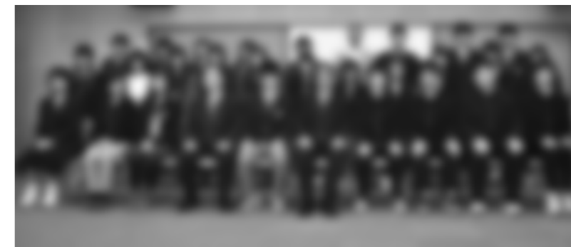
受賞者全員で記念撮影（明科総合支所）

税のしくみや使われ方について理解を深めてもらおうと、松本税務署と市租税教育推進協議会はこの度、市内の中学生、高校生を対象に税に関する作文を募集しました。238点の応募の中から32点の作品が選出され、その表彰式が11月29日、明科総合支所で開かれました。受賞者が一堂に会する表彰式は今回が初めてで、主な賞の受賞者は次の皆さんです。