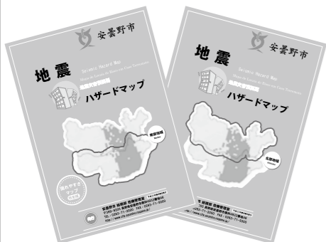
地震ハザードマップ(南部・北部) (A4判カラー8折)