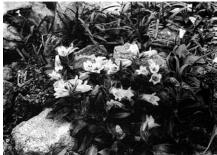
志村烏嶺《イワブクロ》明治末頃