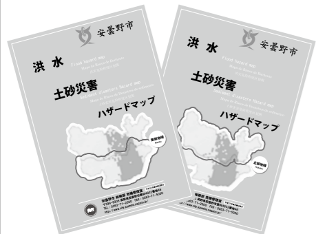
洪水・土砂災害ハザードマップ(南部・北部) (A4判カラー8折)