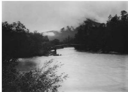
河野齡蔵《河童橋と焼岳》大正～昭和初期