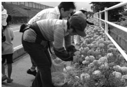
マリゴールドの手入れの様子

アルプス花街道実行委員会では、安曇野市の景観づくりのため、市内道路沿線にいっしょに花の植栽を行っていただける人を募集します。平成23年度からは新たに4箇所が加わり、市内全域の10箇所で行われます。今まで以上に身近で親しみやすい活動となりました。個人はもちろん、企業やグループなどの団体でもご参加いただけます。花を育てながら皆さんで楽しく交流しませんか。詳しくは実行委員会事務局へお問い合わせください。