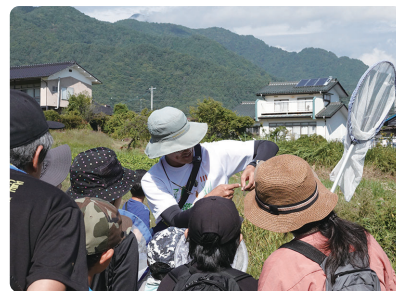
捕まえた昆虫類の身体の特徴や見分け方などを教わりました。