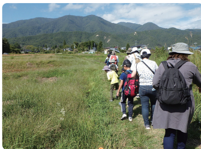
昔ながらの田園風景の中を、生きものを探しながら歩いていきます。