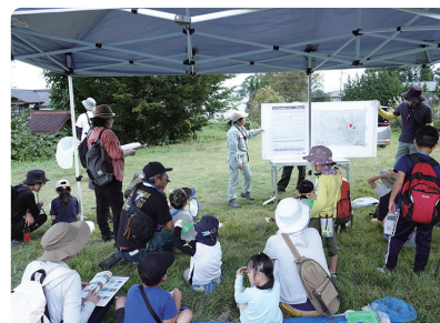
最後に、観察できた生きもの名前を参加者のみなさんに報告していただきました。