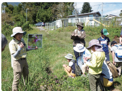
配られたルーペを使って、植物の花や茎の細かい所まで観察しました。