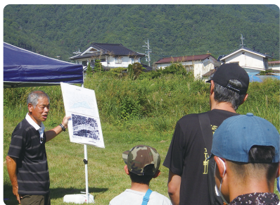
まずはじめに、地域の成り立ちを教えてくださいました。