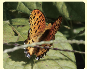
ツマグロヒョウモン