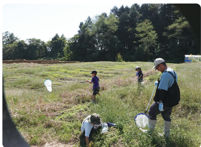
飛んでいるトンボやチョウを捕まえようとみんな奮闘中!