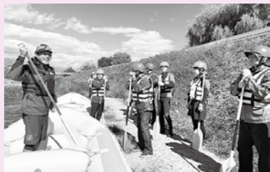
ウォーターアクティビティの実施状況を視察

12月に予定されている次回の策定委員会では、検討内容や現地視察で出された意見、これまでの分科会等での意見を基に、基本構想骨子に係る具体的検討に入る予定です。