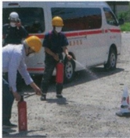
消火器による初期消火訓練