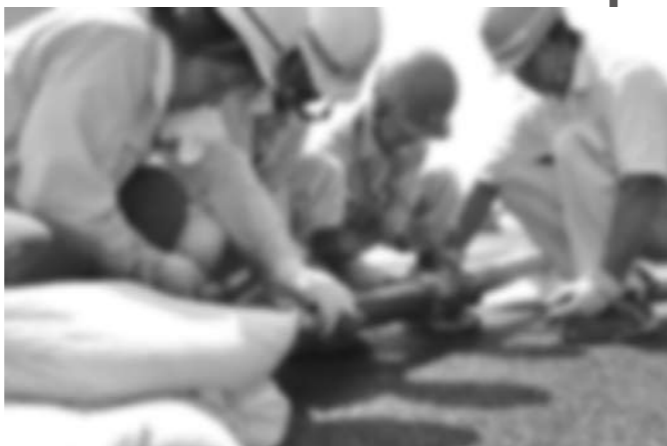
模擬配管による破管箇所の修理訓練の様子

市では今回の訓練結果をもとに、災害時における一層の対応・復旧能力の向上に努めます。