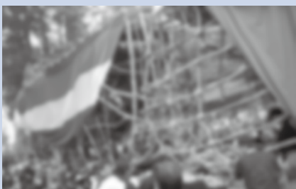
御船祭り、大人船のぶつけ合い

現在、穂高・豊科交流学習センターと豊科郷土博物館で開催している特別展「安曇野のお祭り展1〜オフネがっなぐ地域の輪〜」でも紹介していますので、お出掛けください。