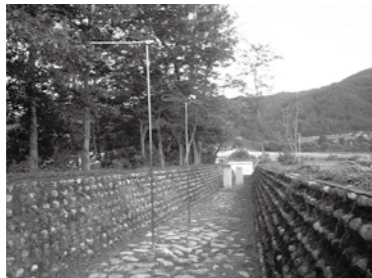
蜂ヶ沢砂防学習公園

青少年自然体験講座「明科みっけ隊」では、「上生野たんけん」の参加者を募集します。蜂ヶ沢砂防学習公園で県下でも珍しい天井川「蜂ヶ沢」を学習。昼は、上生野公民館で地域の皆さんと交流しながらうどんを作って食べ、