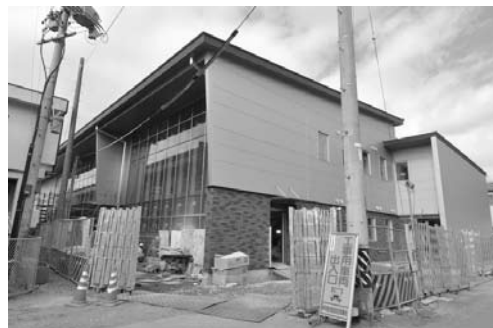
11月末一部完成予定の明科複合施設（11月9日）

住所 安曇野市明科中川手 6824 番地 1 代表 TEL62・3001 FAX62・4747 公民館 TEL62・4605 FAX62・5894