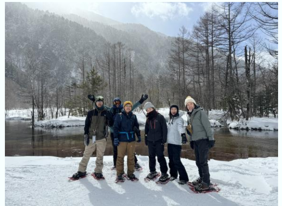
雪を見るために来た、という人も多い

私はいま、登山のガイドをしている。外国人のお客さんを案内する機会も多い。夏は主に欧米からの登山者たち。コロナ明けの昨夏は常念岳、槍ヶ岳、立山から上高地への縦走などたくさんの山を一緒にめぐった。もちろん長峰山にも。長峰山からの眺望には、どの国の人をも感動させる魅力がある。冬は上高地でスノーシューガイド。雪を見たくて日本にやってきた台湾、香港、シンガポールなどアジア圏のお客さんが大半だ。雪を生まれて初めてみる人も多いため、天気が悪く雪が降っているほうが喜ばれることもある。