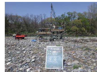
地質調査の作業イメージ