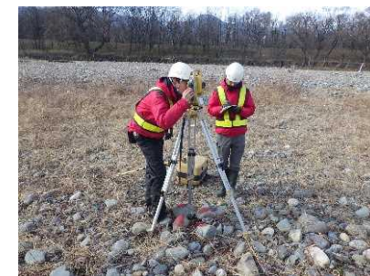
現地測量の作業イメージ