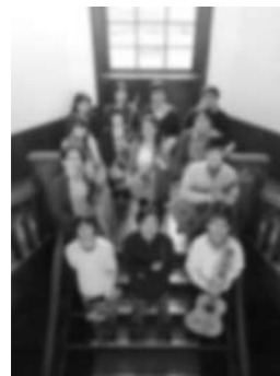
ゲスト 「かなでおん」の皆さん