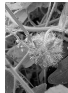
アレチウリの果実のかたまり

※外来生物は、人間の活動によって外国などの地域から持ち込まれた生物のことです。「特定外来生物」は、外来生物の中でも、人間の生命・身体、自然環境、農作物などに被害を与えるとして法律で指定されています。県内では、アレチウリをはじめとしてアライグマ、オオキンケイギク、オオカワヂシャなど計18種が確認されています。 アレチウリは他の動植物に悪影響を与えます アレチウリは、川沿いや畑周辺に生え、多いものでは5000コ