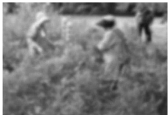
平成 24 年度に徳治郎区で行われたアレチウリ駆除の様子

市では、生態系を壊す特定外来生物であるアレチウリの駆除に力を入れています。安曇野の自然を守るためにも、市民の皆さんのご協力をお願いします。