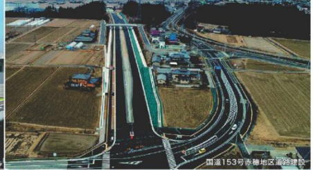
国道153号赤穂地区道路建設