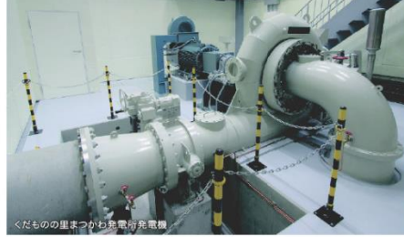
くだもの里まつかわ発電所発電機