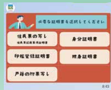
▲市民課関係証明書の申請画面