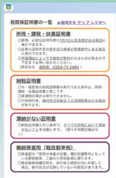
▲税関係証明書の申請画面