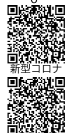
新型コロナウイルスインフルエンザ

②接種期間内に妊娠中の人が 費①1回1000円を2回または1回2000円を1回 ②1回2000円を1回 問健康推進課 Tel 71・2470