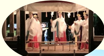
浦安のお祭り 神社の舞