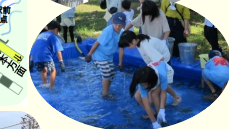
子ども夏祭りのメイン 魚のつかみ取り