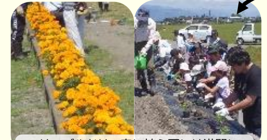
マリーゴールドは、春に植え夏には満開に