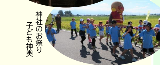
神社のお祭り 子ども神輿