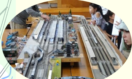
動く鉄道模型展 大人にも大人気