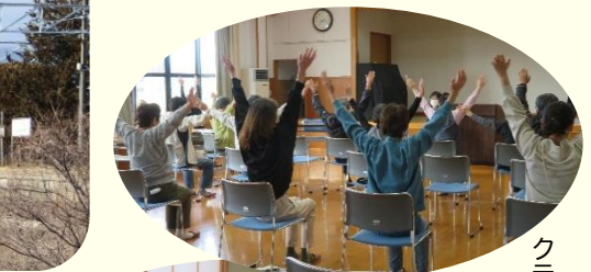
クラブや同好会は あれこれ・色々・様々