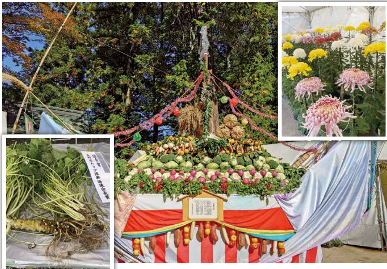
信州安曇野 食の感謝祭(11月2日、3日 穂高神社にて開催)