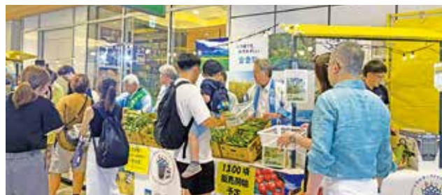
スイートコーン販売の様子