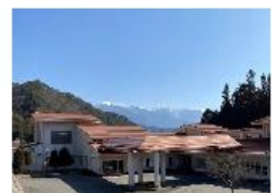
木曽町 なんてんの里