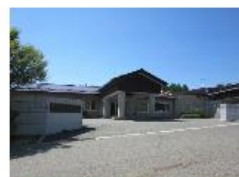
木祖村 サニーヒルきそ