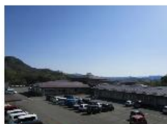
麻績村 サンライフおみ