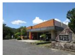
南木曽町 木曽あすなろ荘