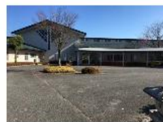
松本 やまびこの里