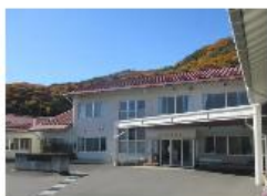
山形村 ピアやまがた