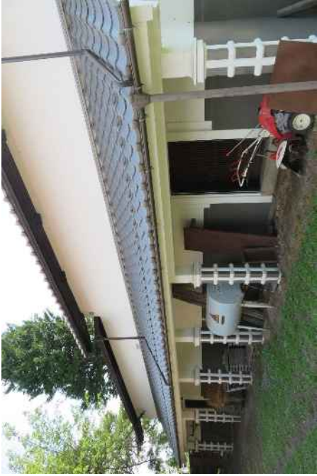
轟家住宅（質屋）土蔵（北東から望む）