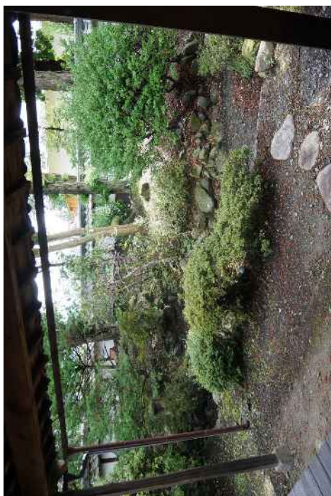
轟家住宅（質屋） その他 中庭（座敷から南を望む）