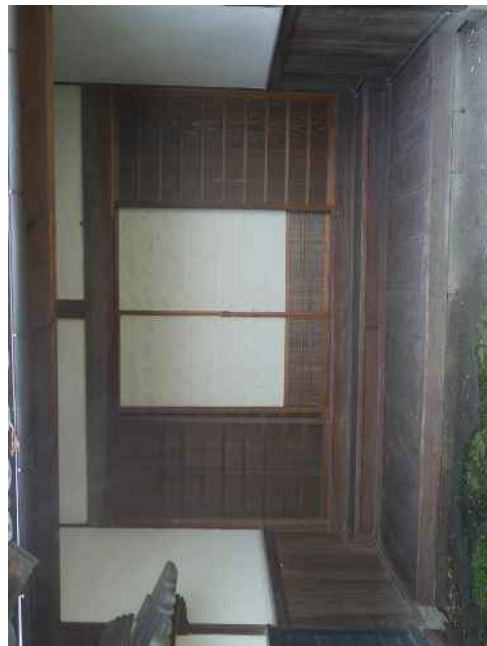
轟家住宅（質屋）主屋 玄関（東から）