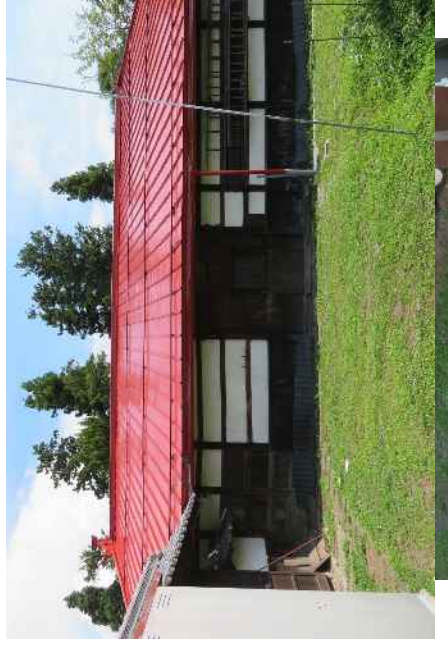
轟家住宅（質屋）主屋 外観（北から望む）