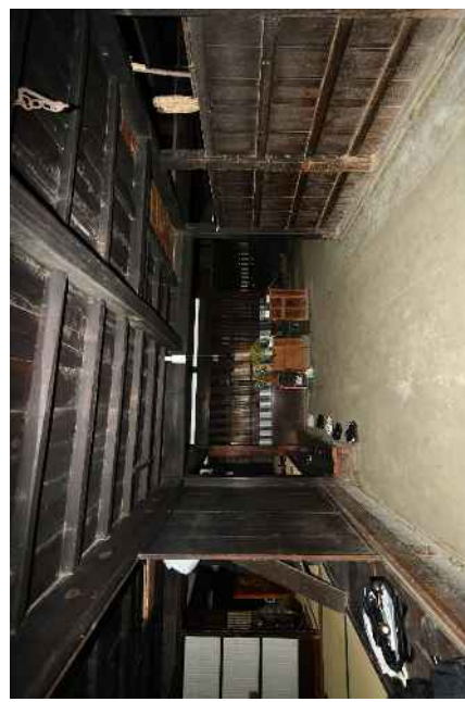
轟家住宅（質屋）主屋 ダイドコ（ドア）（東から）