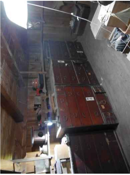
轟家住宅（質屋）土蔵（内部2階）