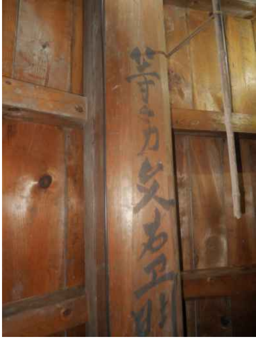
轟家住宅（質屋）土蔵（2階 棟柱の墨書）