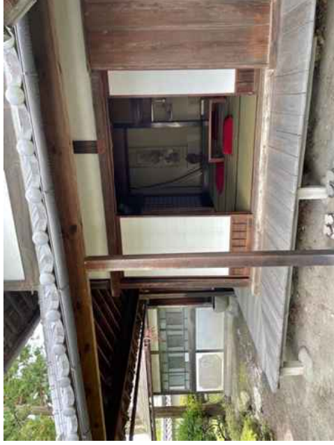
轟家住宅（質屋）主屋 座敷（東から）