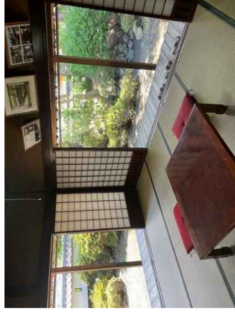
轟家住宅（質屋）主屋 座敷（西から中庭を望む）