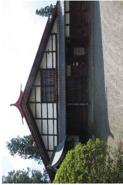
轟家住宅（質屋）主屋 妻面（東から）