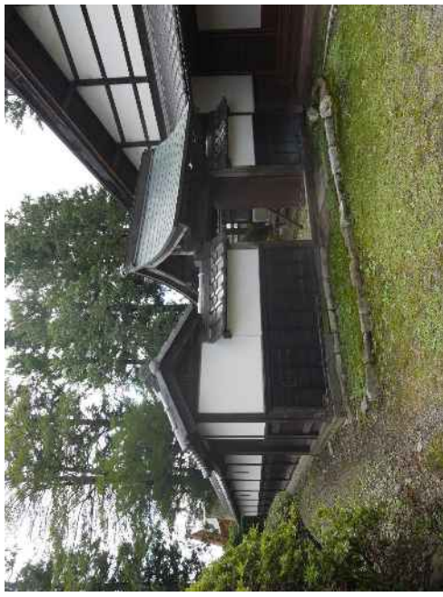
轟家住宅（質屋） その他 主屋東の塀と門