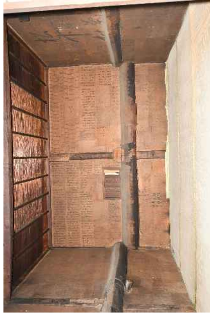
轟家住宅（質屋）主屋（2階の西の部屋）