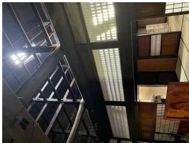
轟家住宅（質屋）主屋 上がりハナ（一階から天井小屋組みを望む）