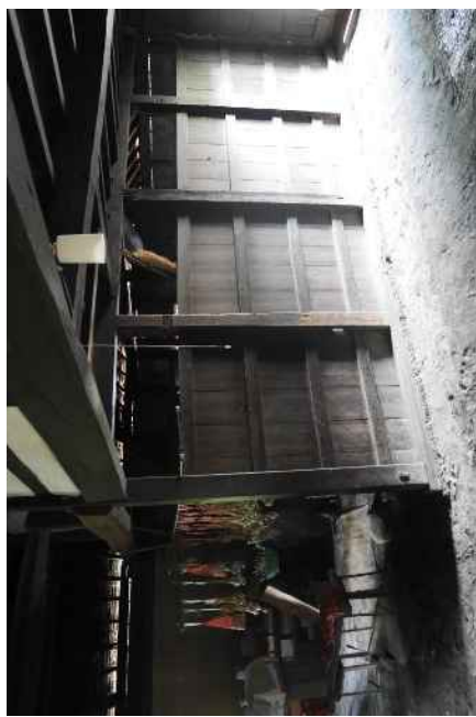
轟家住宅（質屋）主屋 馬屋（南から）