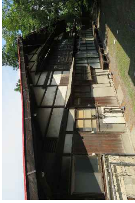
轟家住宅（質屋）主屋 外観（西側の妻面）