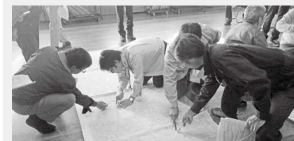
▲昨年度開催の様子

10年後を見据え、地域ごとの課題やその対応策を話し合ったり、離農予定・後継者不在農地1筆ごとに耕作予定者を決めていきます。規模拡大意向がある人と規模縮小や離農意向がある人、土地所有者、市等の関係者で集まり、地図を見ながら話し合います。