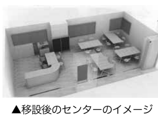
▲移設後のセンターのイメージ