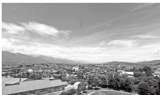
安曇野市役所4階から見える北側の風景

山々がもたらすこうした気候の特性は天気にとどまらず、栽培できる作物や生産できる特産品、また文化にまで影響をもたらしています。