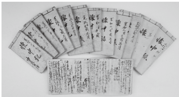
約1万2000点ある山口家文書のうち大庄屋在任中の職務覚書