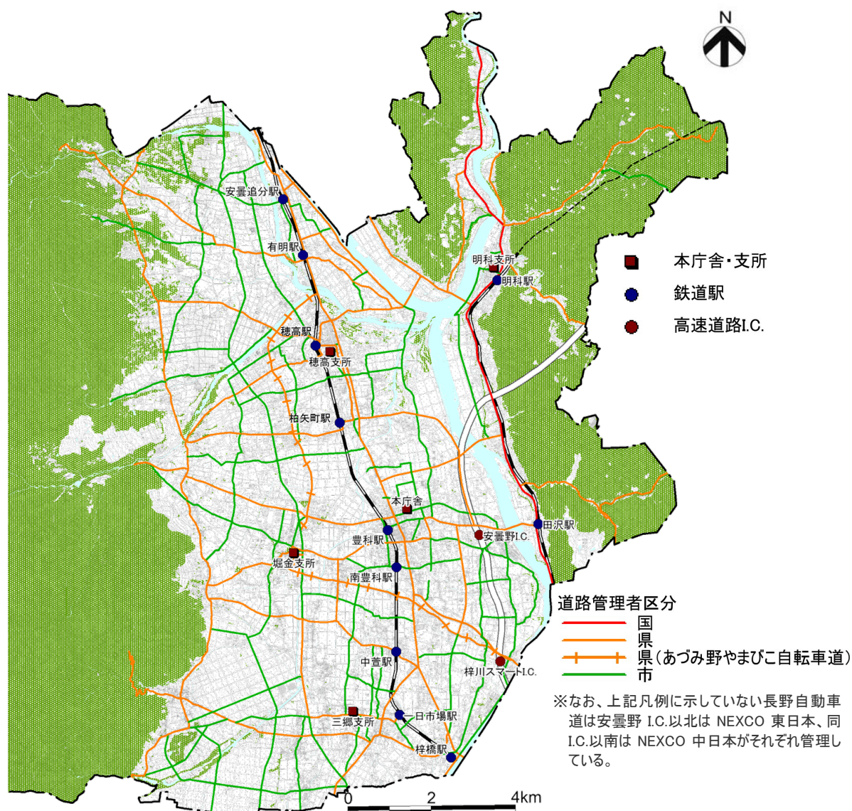
図 1-1 計画対象範囲 1-1

本計画は、安曇野市全域を対象とし、現行道路は、道路管理者にとらわれず、下図に示す市内の幹線道路を対象とする。