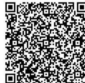
もうしこみ にじげん 申込二次元コード