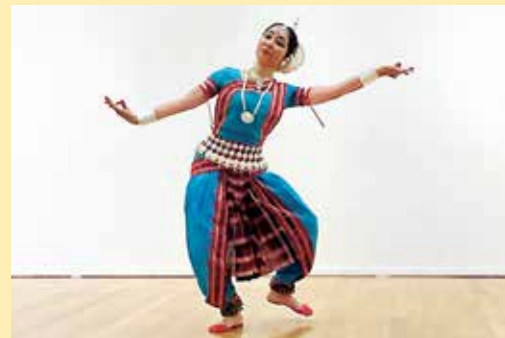
こてん 古典インド舞踊