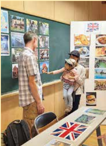
ブース出展 (イギリス)