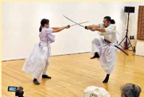
たて 殺陣パフォーマンス