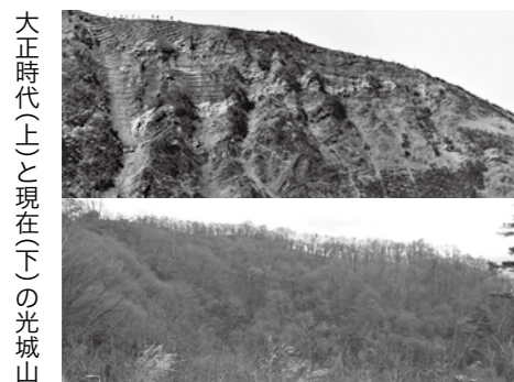
大正時代(上)と現在(下)の光城山

土壌は、地中と地上に生きる動植物の活動が蓄積して作られています。植林された森林にはその樹種の枝葉や根、火入れをした草原には黒い灰が蓄積するなど、私たち人間の生活は、蓄積する土壌に大きく影響を与えています。写真は、今から約100年前の大正時代と現在を比較した光城山です。燃料材や建築材を生産していた大正時代は、人間が伐採し尽くしたため木がほとんど生えていません。露出した地面に雨が降ると土壌は流され、土砂災害が発生することもあります。そこで当時の長野県はアカマツやカラマツ、クヌギなどを植林する治山事業を行いました。こうしてむき出しになっていた地面には、木々の成長と共に