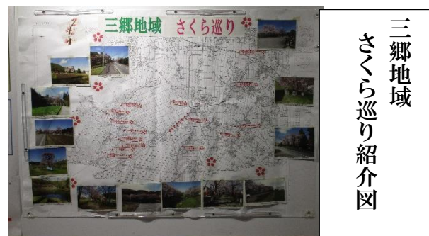
◇三郷地域の桜の名所案内です。時期が間に合うといいです。