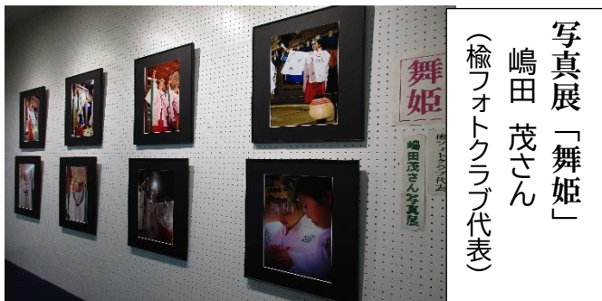
◇地域のお祭りの舞子さんの眼差しに、思わず息をのみます。