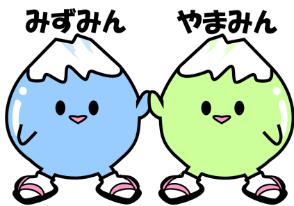
安曇野市区長会キャラクター