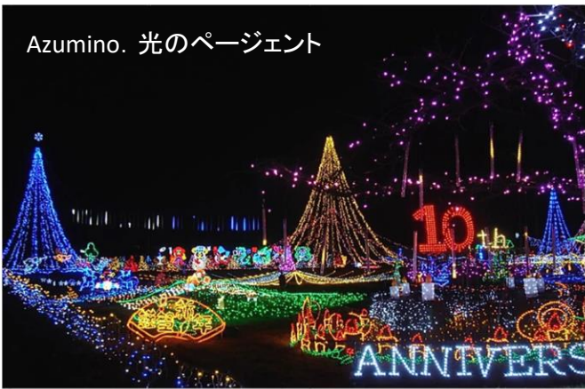
Azumino. 光のページェント