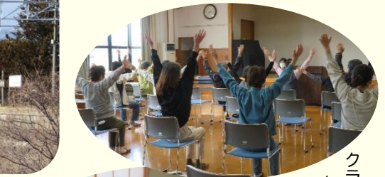
クラブや同好会は あれこれ・色々・様々