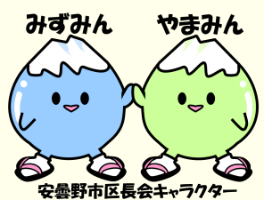
安曇野市区長会キャラクター

災害伝言ダイヤル 171 ※ダイヤルは、ガイダンスに従って、 録音・再生を行ってください。 ※録音時間 30秒