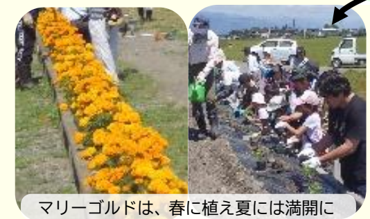
マリーゴールドは、春に植え夏には満開に