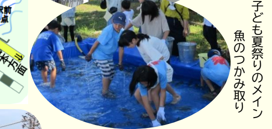
子ども夏祭りのメイン 魚のつかみ取り