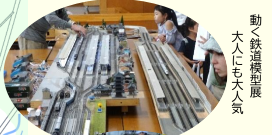
動く鉄道模型展 大人にも大人気