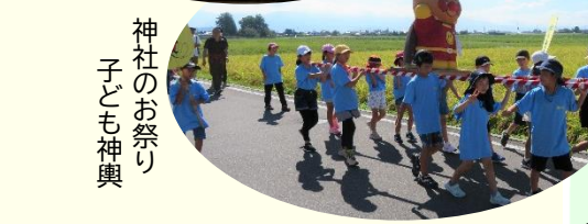
神社のお祭り 子ども神輿