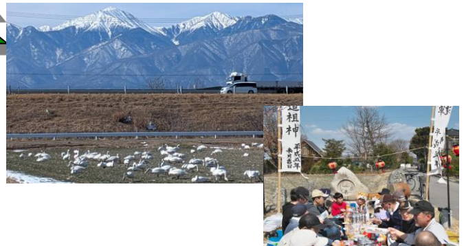
白鳥の飛来 道祖神祭り

※木戸数6：南から東木戸、南木戸、上手木戸 中花見、中木戸、下木戸 ・区費は6500円/年、年2回徴収(4月、7月)