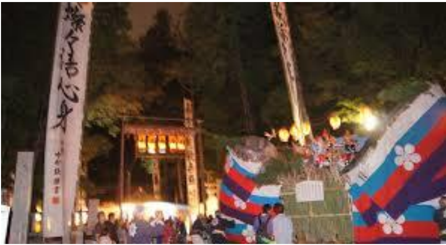
矢原神明宮例大祭