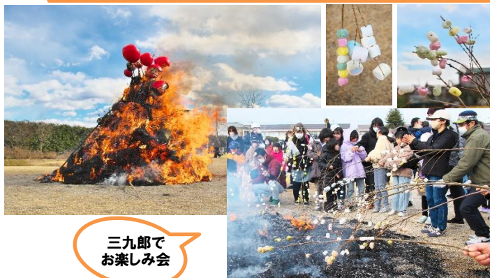
三九郎で お楽しみ会