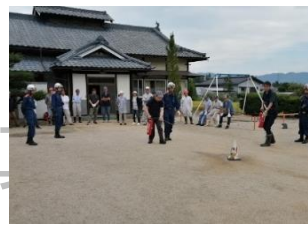
ボランティア会 防災訓練・救急救命訓