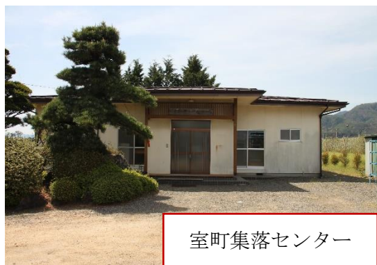
室町集落センター