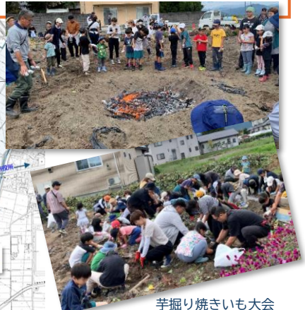
芋掘り焼きいも大会

☆安曇野市のほぼ真ん中あたり.. 区の中央には諏訪神社や下堀公園があり、 その間を拾ヶ堰が南から北にゆっくりと 流れています。拾ヶ堰は、江戸時代中期 に近隣の農民が工事に携わり、わずか3 か月で完成させたもので、今でも田園都 市安曇野を支えています。下堀はこの 拾ヶ堰を抱いて常念岳を望み、田園と屋 敷林が織りなす風景を堪能できるところ です。日当たりよく住みやすい地域で、 区内には750戸、約1,720人が暮らし、 うちの約1/3は他の地域から移住された 方です。