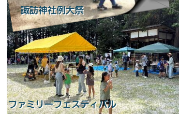
ファミリーフェスティバル