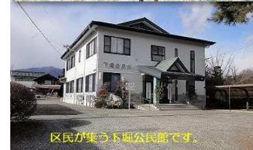
区民が集う下堀公民館です。