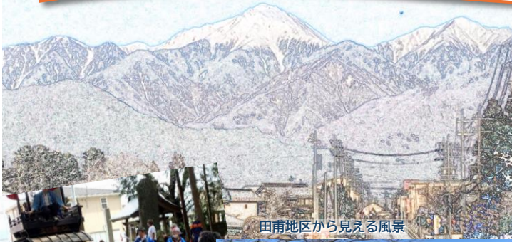
田南地区から見える風景