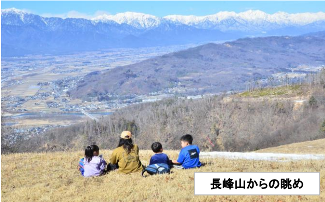
長峰山からの眺め