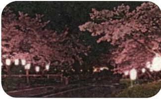
あやめ公園、龍門淵公園 桜(見頃:4月) 花菖蒲(見頃:6月)