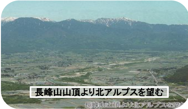
長峰山山頂より北アルプスを望む