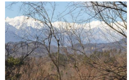
岩州林道より北アルプスを望む