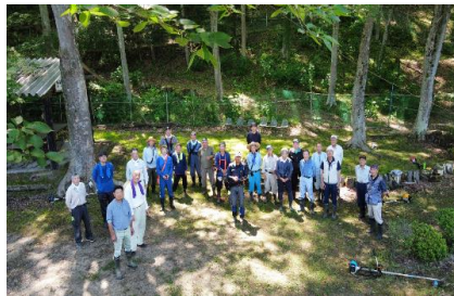
ケヤキの森自然園草刈