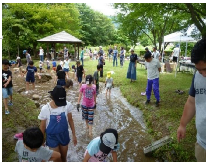
【7月】 ニジマスのつかみ取り(古厩親水公園)