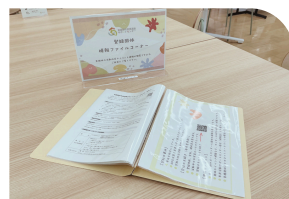
登録団体の情報ファイルコーナー