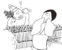
④昔、光源氏が、野宮に六条御息所を訪ねた日であることや、