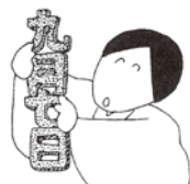
③今日は9月7日で、昔を偲ぶ日だと言い、