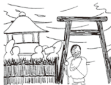
⑥源氏の訪問の後、伊勢へと下向したことを語ります。