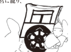
⑨すると、車に乗った御息所が現れ、