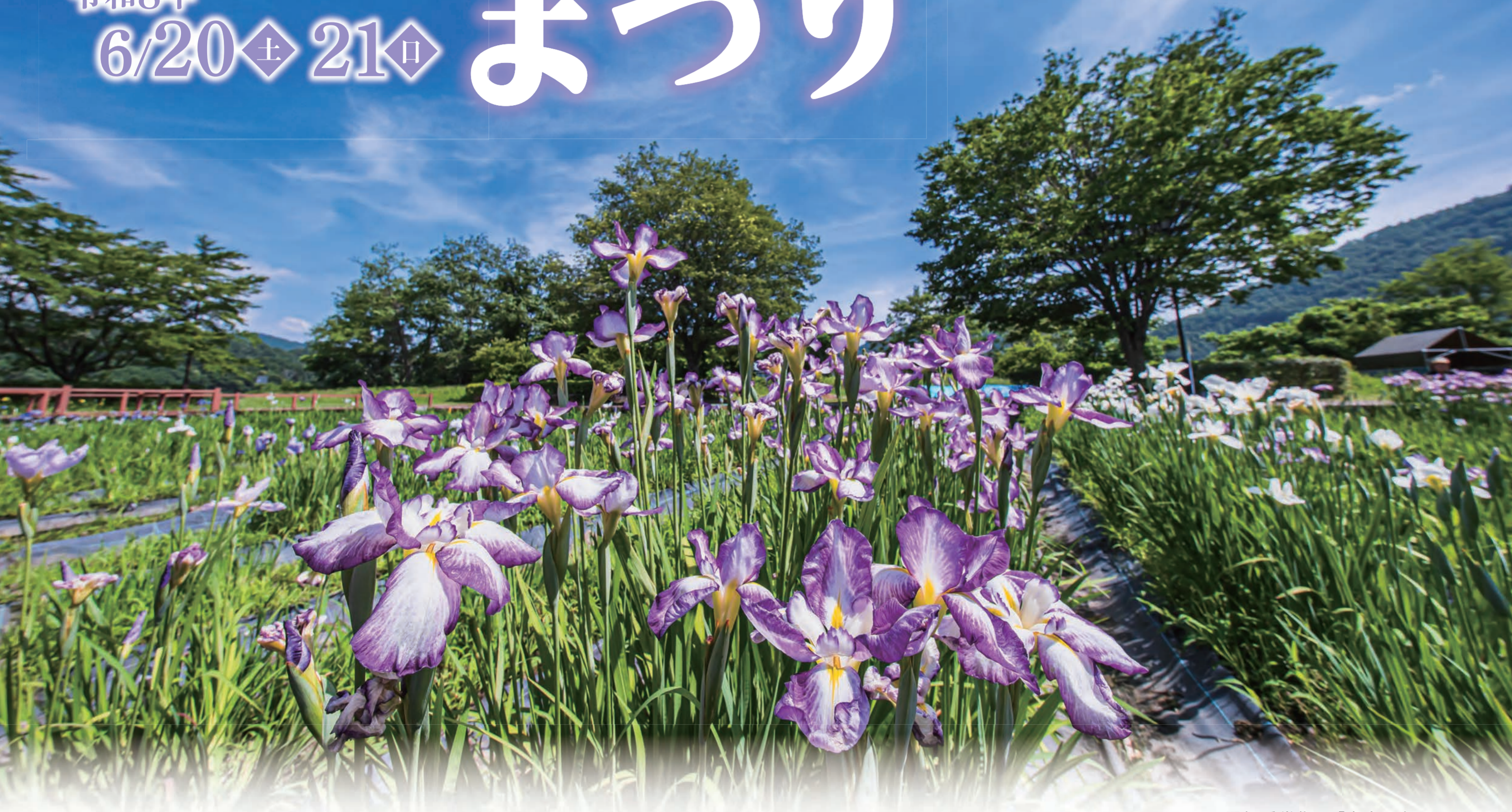
2025あやめまつりフォトコンテスト最優秀賞作品「青空に向かって」