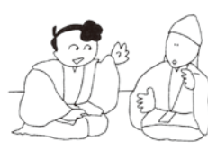
⑧そこで、僧は、来合わせた里人に御息所について尋ね、夜もすがら用います。