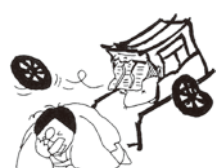
⑩葵上との車争いに敗れたことを嘆き、妄執を晴らしてほしいと頼みます。