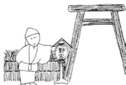
①ある秋の夕暮れ、旅僧が、嵯峨野の野宮を訪れると、