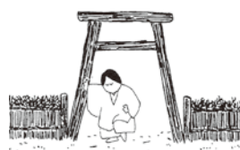
⑫迷いから抜けられない自分を顧みつつ、また車に乗り、消えて行きます。