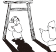
⑦そして、自分こそ御息所だと名のり、姿を消します。