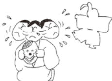
⑤御息所が、絶えがちな源氏との恋仲を精算すべく、斎宮になる娘に連れ添って野宮に籠り、