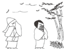
②忽然と一人の里女が現れ、僧が問いかけると、