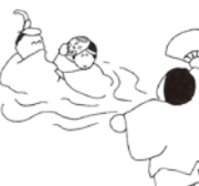
⑪そして、昔を偲んで舞をまい、源氏の訪れを思い起こして懐かしみ、